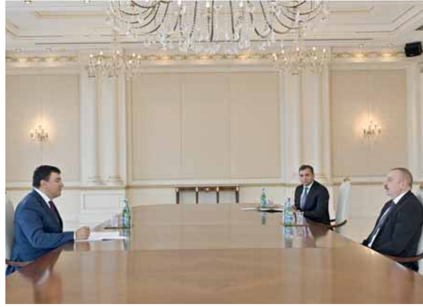
Prezident İlham Əliyev mayın 24-də Özbəkistanın Baş nazirinin müavini, turizm və mədəni irs naziri Aziz Abduhakimovu qəbul edib.

Söhbət zamanı əməkdaşlığın perspektivləri ətrafında fikir mübadiləsi aparılıb.