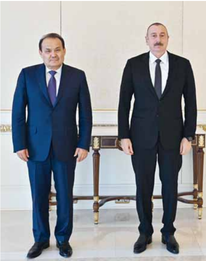
Prezident İlham Əliyev mayın 24-də Türk Dövlətləri Təşkilatının (TDT) Baş katibi Bağdad Amreyevi qəbul edib.

Görüşdə Türk Dövlətləri Təşkilatı çərçivəsində müxtəlif istiqamətlərdə uğurlu əməkdaşlığın həyata keçirildiyi qeyd olunub, Azərbaycanın bu Təşkilatın fəaliyyətində rolu yüksək qiymətləndirilib.